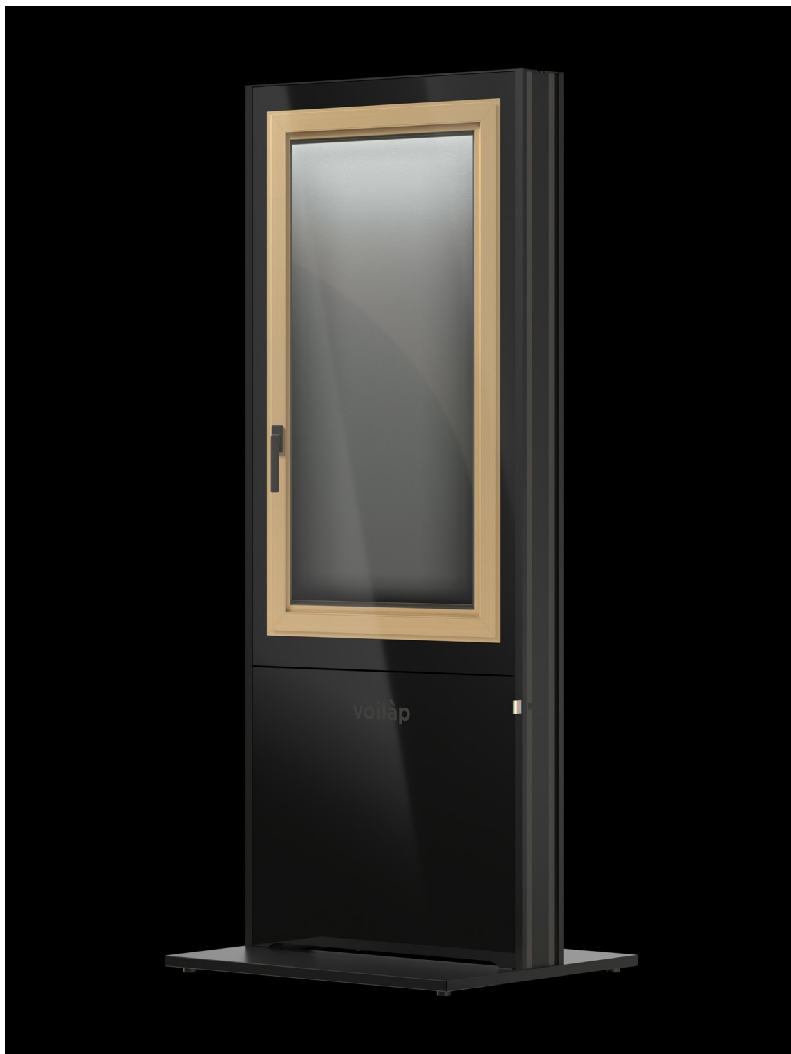
Sight Full Glass